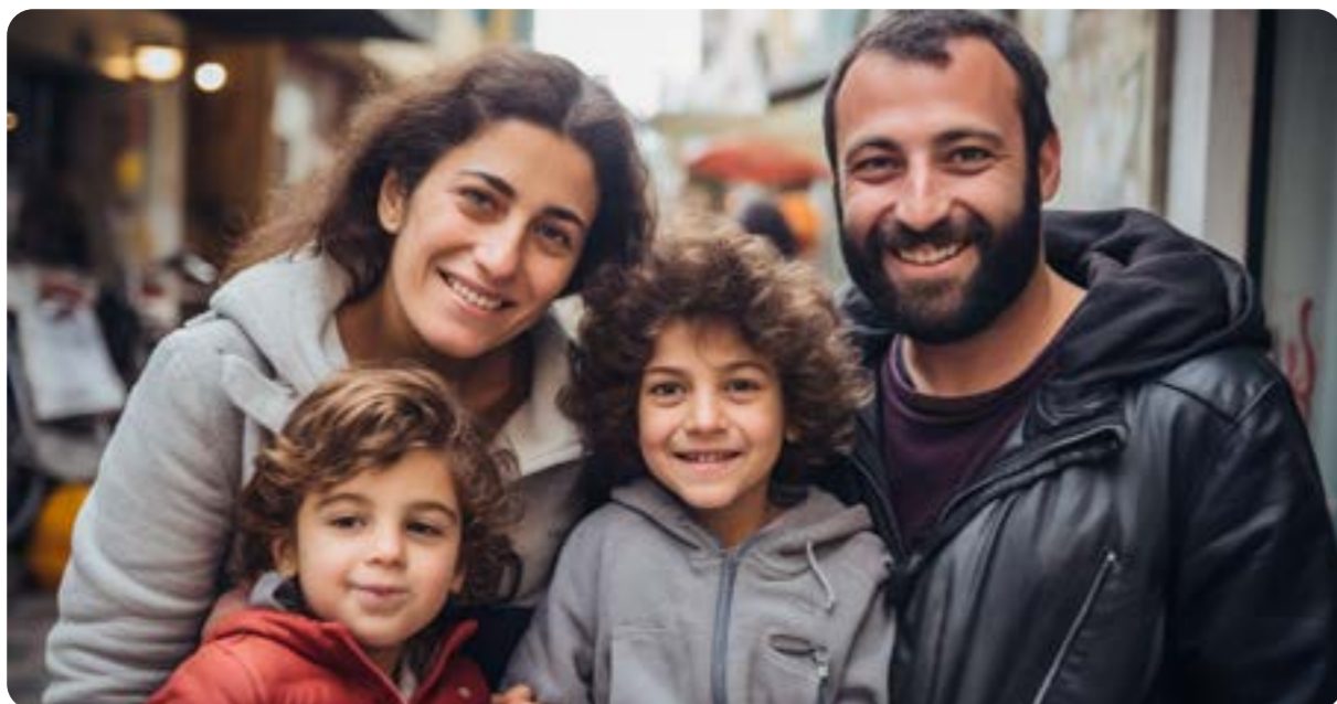
תמונות להמחשה בלבד. חלק מהשמות שונו במטרה לשמור על פרטיות